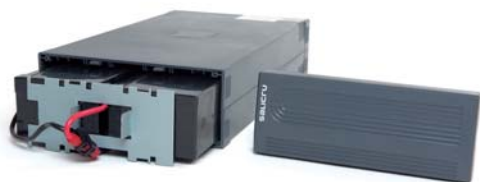
► Reemplazo de baterías