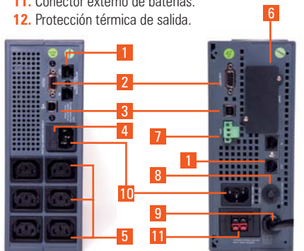
► Modelos 750 / 1000 VA