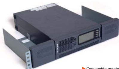
► Conversión montaje diseño en Rack