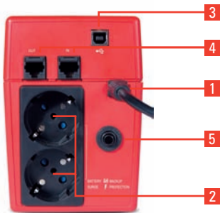
► Modelos 400 / 600 / 800