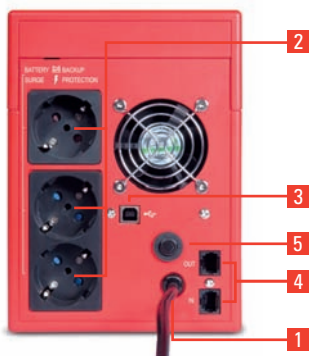
► Modelos 1000 / 1400 / 2000