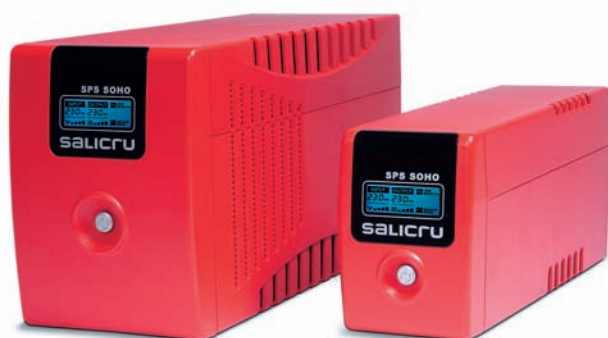
► Equipos SPS SOHO

También incorporan, para una mejor integración en el entorno protegido, comunicación vía USB con un completo software de monitorización y control capaz de autoapagar los sistemas informáticos en caso de cortes prolongados. Asimismo, incorporan, de serie, un potente display con las informaciones de tensión de entrada, tensión de salida, nivel de carga, nivel de baterías y estado de funcionamiento. Y para una protección completa incluye un filtro para la línea de datos/módem/ADSL. Todas estas características los convierten en la solución SAI con mejor relación calidad/precio del mercado.